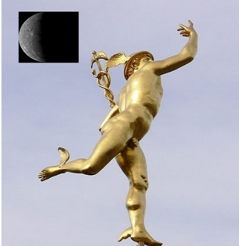
Mercurio, il messaggero degli Dei

Sperando nelle condizioni meteo favorevoli, il 9 Maggio 2016, avremo la possibilità di osservare nuovamente il transito sul disco del nostro Sole del pianeta più interno del Sistema Solare: Mercurio. L'ultimo avvenne nel 2003; mentre l'ultimo visibile dalla Terra risale alla data dell'8 Novembre 2006. Comunque, al di là delle condizioni meteorologiche, il transito di Mercurio sul