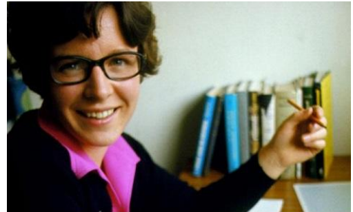
Fig.1 Jocelyn Bell

E' la domanda che si pose Jocelyn Bell (Fig.1) giovane ricercatrice britannica, quando scoprì un piccolo segnale che si ripeteva ogni 1,3 secondi. Un intervallo troppo corto e regolare per provenire da un Quasar (un Quasar è un nucleo galattico attivo estremamente luminoso e generalmente molto distante dalla Terra). Ed allora se questa radiosorgente non proveniva da un Quasar, che cosa era?