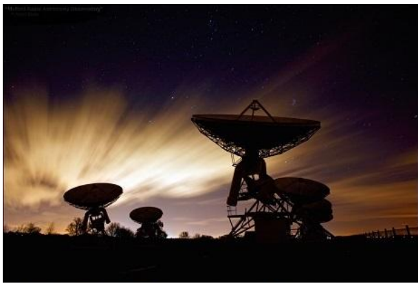
Fig. 3 Mullard Radio Astronomy Observatory

Quindi per chi sognava "Incontri ravvicinati del terzo tipo", dovette rassegnarsi! Tuttavia, quella di Jocelyn Bell fu una scoperta straordinaria, tanto che i risultati delle osservazioni del gruppo di ricerca di Cambridge, nel 1968 furono pubblicati in prima pagina dalla rivista Nature, riportando a tutta pagina l'articolo "Osservazioni in banda radio di un segnale che pulsa rapidamente" di cui il Prof. Antony Hewish, ritenuto lo scopritore e Jocelyn Bell la seconda autrice. Così Antony Hewish un radioastronomo britannico, divenne il vincitore del Premio Nobel per la fisica nel 1974 per il suo contributo allo sviluppo della radioastronomia e per il suo ruolo nella scoperta delle Pulsar. Durante il suo discorso tenuto in occasione del ritiro del Premio Nobel, il Prof. Hewish rivolse poche parole di ringraziamento a Jocelyn Bell, riferite soltanto al compito da lei svolto. Ma la Bell continuò imperterrita la sua carriera di astrofisica, occupando posti di prestigio, quali la presidenza della Reale Società