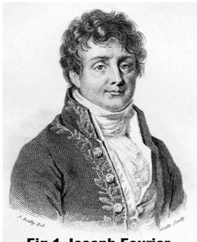
Fig.1 Joseph Fourier

La ricerca Radio SETI (Search for Extra Terrestrial Intelligence) consiste nel rilevare un eventuale segnale radio molto debole discriminandolo ed estraendolo dal rumore cosmico di fondo ed analizzarlo. Quando SETI nacque nel 1959, era ovvio tentare questa estrazione in virtù dell'unico algoritmo conosciuto all'epoca: la FT (Fourier Transform) ovvero: la trasformata di Fourier [Fig.1]. I radioastronomi SETI avevano adottato a priori il punto di vista pregiudiziale che un segnale candidato extraterrestre sarebbe necessariamente sinusoidale e a banda stretta, stimandolo con l'uso